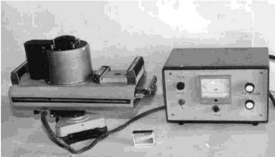
Рисунок 1 – Загальний вид приладу ЛаСК-1

Загальний вид приладу (лазерний варіант) показаний на рис.1, на рис.2, представлена схема розробленого стабілізатора [2].