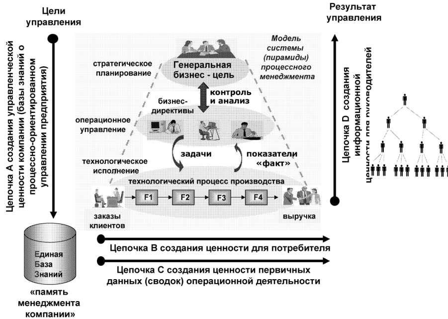
Рис. 2. Модель системы четырех цепочек создания ценности предприятия (авторская модель)

Исходя из определения 2, можно утверждать, что вариативными элементами инновационного развития методологии процессного бизнес-моделирования являются методы синтеза бизнес-процессов системы четырех цепочек создания ценности предприятия БЗ процессно-ориентированного менеджмента в их визуальных нотациях. При этом, следуя указанной выше цепочке прагматичного решения методологической проблемы «методология – методы – методики», ключевым является решение задачи синтеза методик выделения, композиции и графического описания бизнес-процессов, которые в свою очередь (методики) при их постоянном развитии могут являться источником знания по инновационным преобразованиям качества системы менеджмента предприятия.