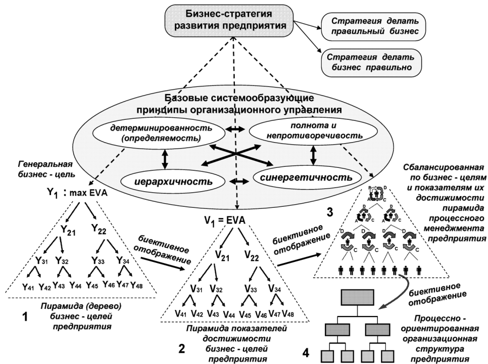
Рис. 1. Модель инновационного механизма реализации инжиниринговой концепции «организационная структура следует за стратегией» [6]

В контексте определения 1 в качестве модели инновационного механизма реализации инжиниринговой концепции «организационная структура следует за стратегией» предлагается использовать модель, представленную на рис. 1. Данная модель отражает суть бизнес-целевого подхода к решению задачи обеспечения экономической устойчивости предприятия: ориентация организационной структуры управления предприятия на его систему бизнес-целей. При этом в качестве генеральной стратегической бизнес-цели предлагается выбрать максимизацию экономической добавленной стоимости EVA (англ, Economic Value Added).