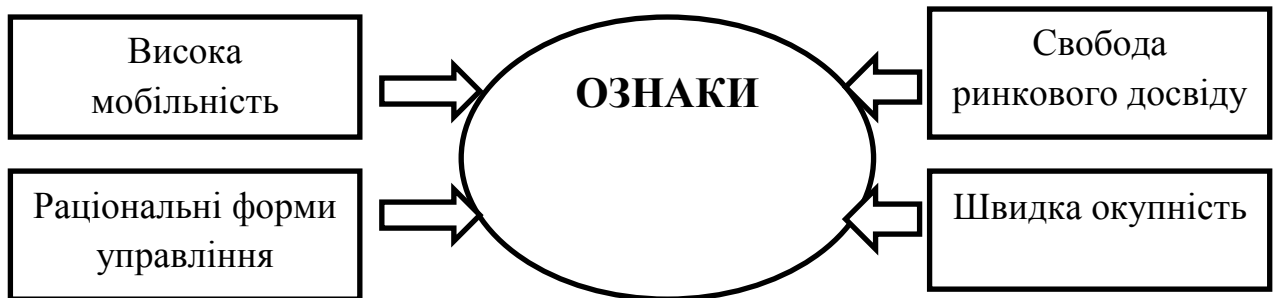
Рис.1. Ознаки малого підприємства

Існують ряд критеріїв за якими розрізняють підприємства малого бізнесу, проте вони є варіативними для різних країн, в Україні основними є показники, які наведені на рис.1.