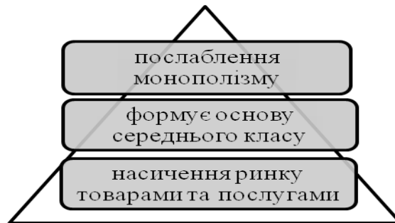
Рис.3. Основні критерії доцільності існування підприємств малого бізнесу

особливо гостро постає необхідність існування даних підприємств, про що свідчить рис.3.