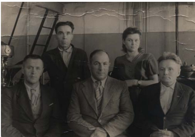
Кафедра паровых и газовых турбин. 1949 г.

В послевоенное время авиадвигателестроение продолжало стремительно развиваться, а отработавший свой лётный ресурс ГТД предложено использовать в наземных целях – в энергетике, на транспорте, в качестве приводных двигателей газоперекачивающих агрегатов. Являясь уникальной и высокотехнологичной составляющей двигателестроительной отрасли, газотурбостроение привлекло внимание ученых и специалистов, которые занимались вопросами теоретического и промышленного развития газотурбинной техники. Спектр практического использования ГТУ значительно расширился и требовал соответствующей инфраструктуры, заводов, обслуживающих предприятий, высококлассных специалистов.