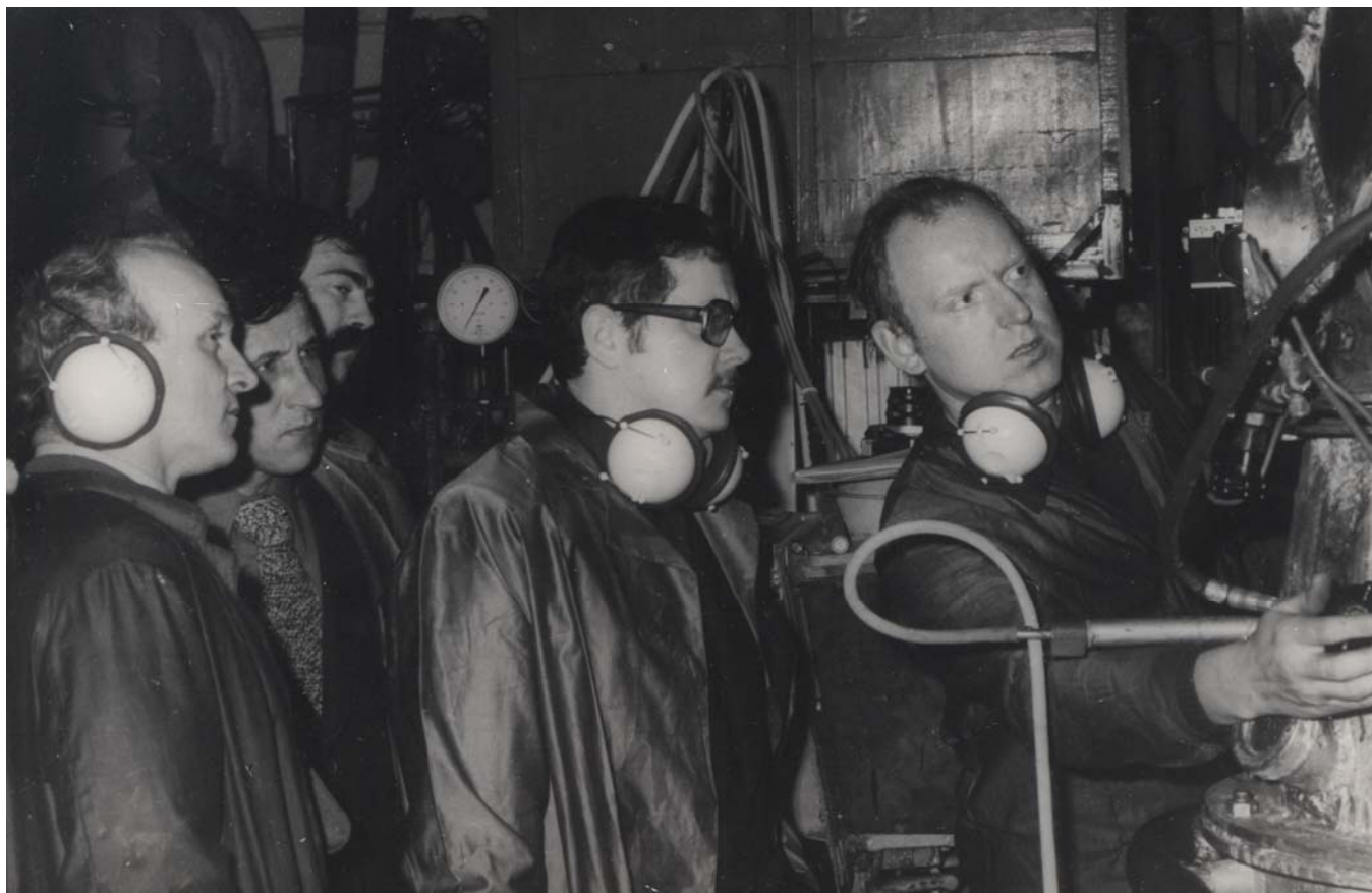
Исследования газотурбинных камер сгорания - горячий и шумный эксперимент (интернациональная бригада исследователей, КПИ - Вроцлавская политехника)

ных выбросов заключается в том, чтобы окислить (разложить) токсические компоненты этих отходов в вещества, безвредные или менее токсичные для окружающей среды. На основе струйно-стабилизаторного метода КПИ были разработаны и изготовлены в ВПИ два варианта экспериментальных газовых горелок. Исследование велись параллельно на стендах КПИ и ВПИ, отличающихся схемами горелок, масштабными факторами, режимными условиями и видом топлива, следовательно, дополняющими друг друга в рамках программы исследований.