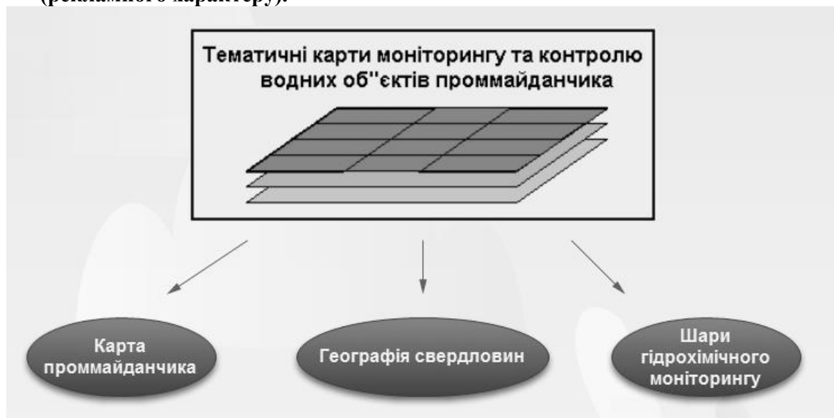
Картографічне представлення даних моніторингу

14. Фото або декілька слайдів презентації з фото розробки в електронному вигляді (рекламного характеру).