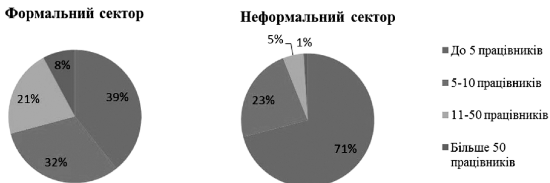
Рис. 2. Частки неформально зайнятих найманих працівників в формальному та неформальному секторах за розмірами підприємств, %

2. Присутність у формальному секторі. Частіше за все в ньому така зайнятість носить характер неналежної реєстрації трудових відносин. У випадку з найманими працівниками її характеристики та поширеність в залежності від приналежності до певного сектора економіки дещо різняться. Аналіз статистичних даних свідчить про те, що в середньому серед усіх зайнятих в формальному секторі тільки приблизно 5,64% працівників працюють «в тіні», в той час як серед найманих працівників неформального сектору таких більше половини – 66,5% [4]. У неформальному секторі така зайнятість сконцентрована більшою мірою на малих підприємствах (94% найманих працівників працюють на підприємствах, де зайнято до 10 осіб включно), водночас у формальному вона має порівняно рівномірну поширеність, хоча тенденція падіння частки неформально зайнятих осіб зі збільшенням розміру підприємства прослідковується чітко (рис. 2).