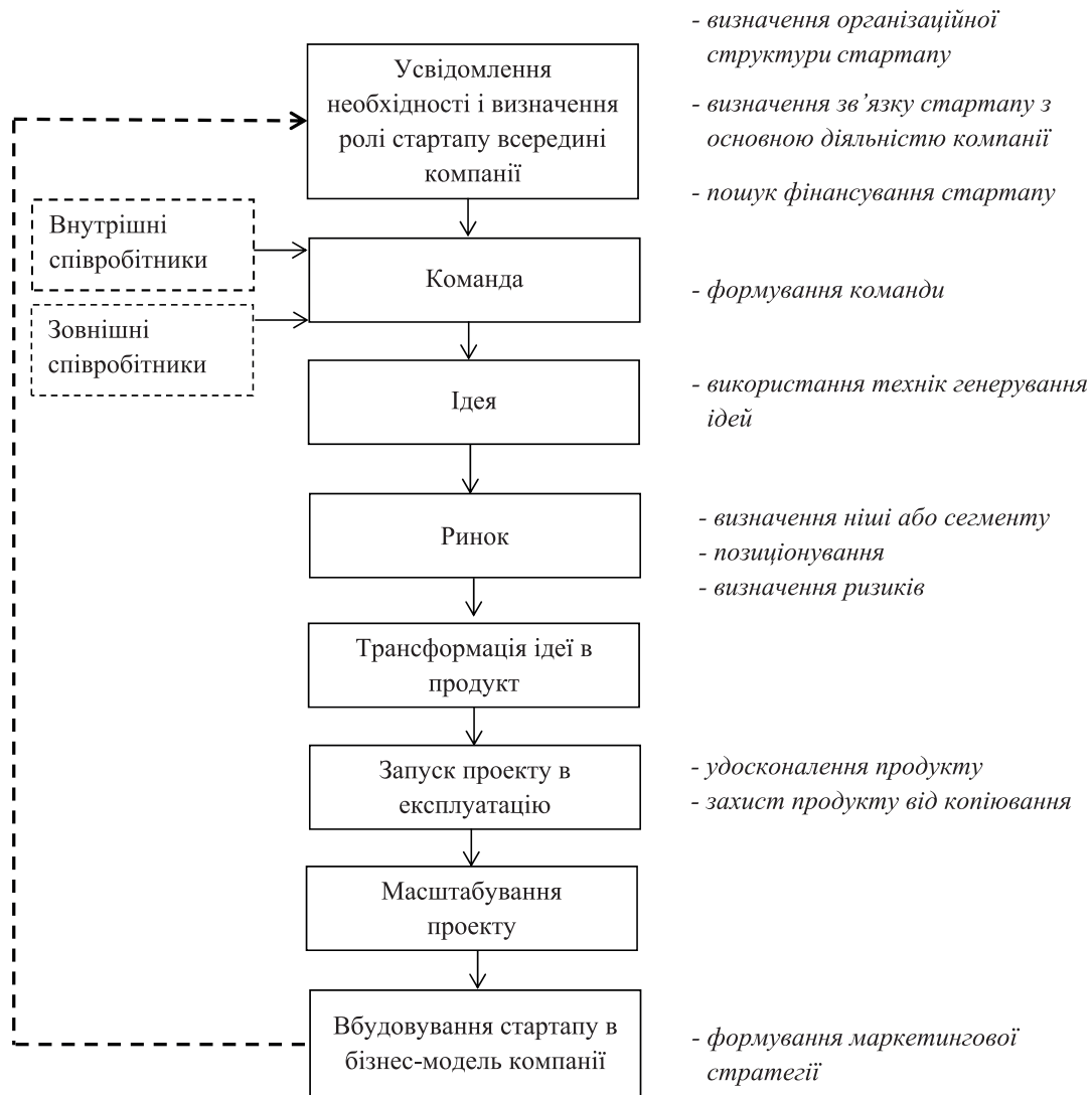
Рис. 3. Бізнес-модель афілійованого стартапу Джерело: авторська розробка

Отже, після формування моделей розвитку незалежного та афілійованого стартапів ми бачимо відмінність як в послідовності етапів, інститутів та осіб задіяних в розвитку стартапів, а отже існує значна відмінність в маркетингових діях, які необхідно застосовувати. Визначимо та порівняємо етапи розвитку стартапів, їх характеристики та маркетингові дії в таблиці 2.