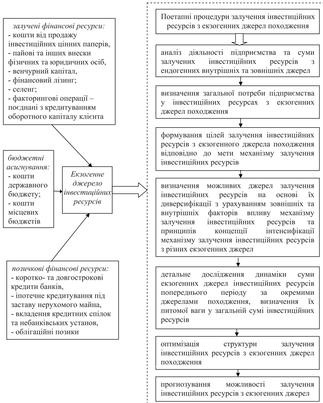
Рис. 2. Схема поетапних процедур щодо реалізації механізму залучення інвестиційних ресурсів по відношенню до формування інвестиційних ресурсів екзогенних джерел походження

У свою чергу, банківські позикові інвестиційні ресурси можуть бути виражені через: бланковий, контокорентний, сезонний, інвестиційний потік по кредитній лінії, револьверний, онкольний, ломбардний, іпотечний, ролловерний, консорціональний кредитний потік.