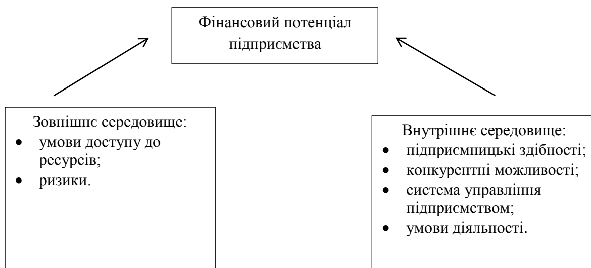
Рис. 2. Фактори впливу на формування фінансового потенціалу підприємства

Відобразимо вплив факторів на формування фінансового потенціалу підприємства (рис. 2).