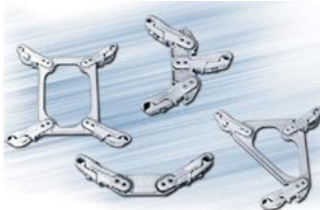
Рисунок 3 – Загальний вигляд демпферних розпірок

Сьогодні в країнах Європи та Північної Америки виконується перехід до систематичного використання демпферних розпірок. Приклади таких розпірок наведено на рис. 3.