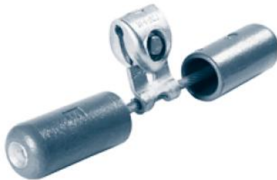
Рисунок 1 – Загальний вигляд віброгасників ПЛ 35-330 кВ

На лініях напругою від 35 до 330 кВ встановлюють віброгасники, виконані у вигляді двох вантажів, підвішених на сталевому тросі (рис. 1).