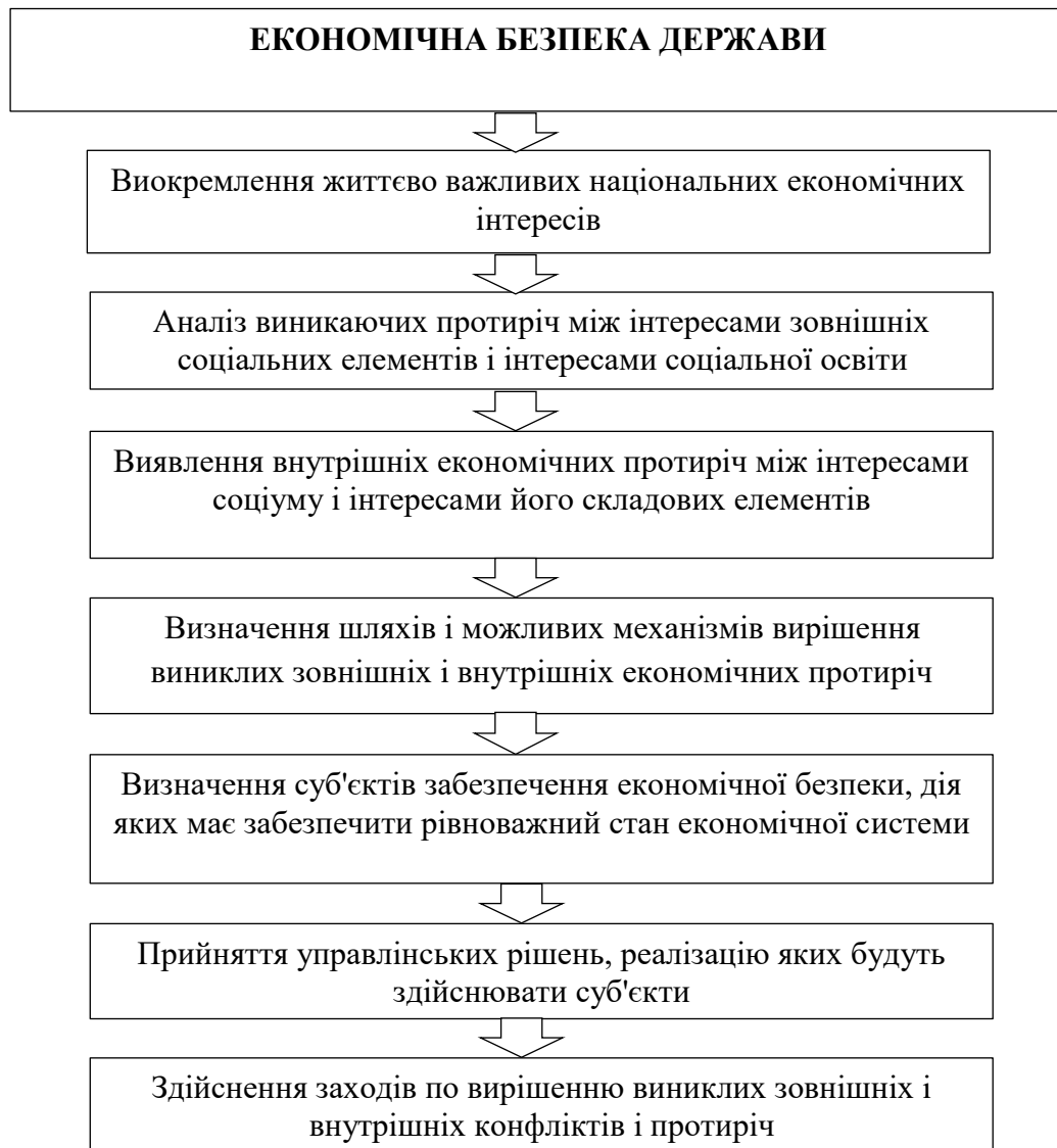
Рис.1 Алгоритм економічної безпеки

Алгоритм забезпечення економічної безпеки як характеристика діяльності по досягненню стабільного, стійкого стану і розвитку економічної структури включає кілька етапів (рис.1).