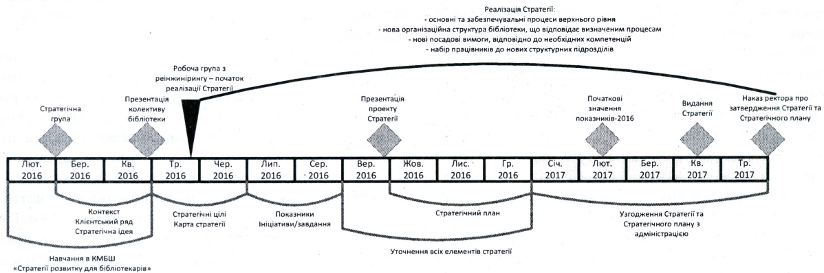
Схема 1. Основні етапи розроблення та впровадження стратегії розвитку Бібліотеки КПІ

Загальну часову шкалу основних етапів розроблення та впровадження стратегії розвитку Бібліотеки КПІ представлено на схемі 1.