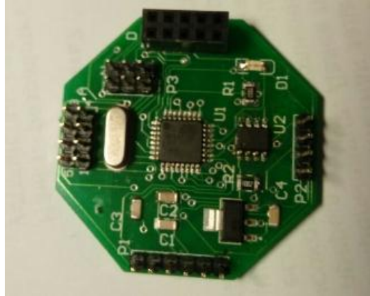
Рис. 2. Мікроконтролерний міні-модуль збору даних і керування: апаратна частина

Перевагою розробленої системи є висока точність, легкість виконання, універсальність і зручність при використанні, низька вартість. Недоліком є те, що на даний час налаштування та монтаж системи можливий лише з певним рівнем кваліфікації.