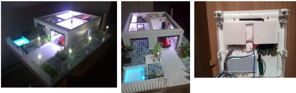
Рис. 3. Система моніторингу температурних показників оточуючого середовища: апаратна частина