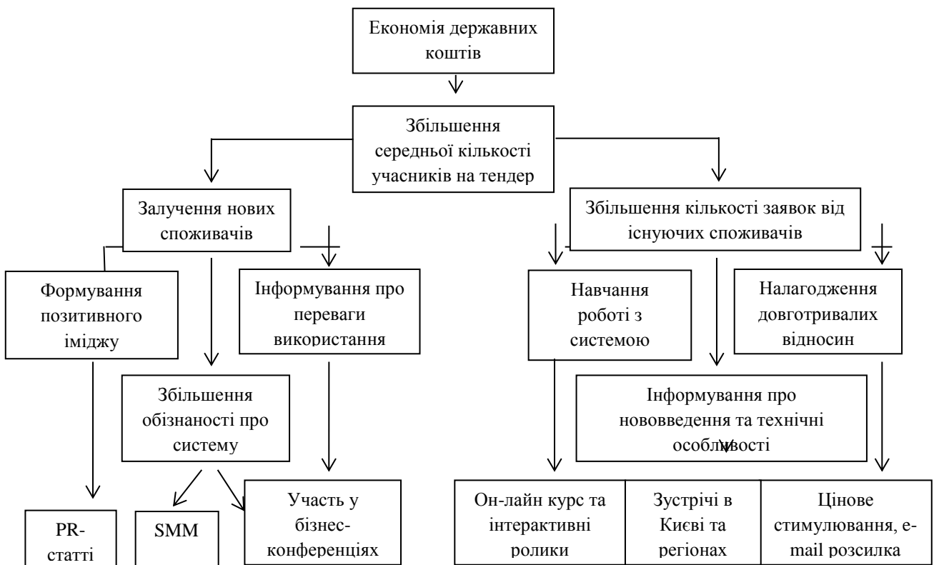
Рисунок 5 - Дерево цілей для системи державних закупівель.

Для визначення окремих інструментів та каналів комунікацій, що будуть направлені на вирішення конкретних завдань підприємства, та за допомогою яких досягається головна мета його функціонування, скористаємось методикою створення дерева цілей підприємства. Виокремимо лише частину стратегічних завдань державного підприємства, а саме, пов'язану з економією державних коштів. Дерево цілей для державного підприємства «ПроЗорро» наведено на рисунку 5.