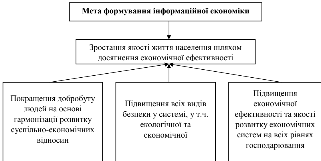
Рисунок 2 – Мета формування інформаційної економіки

Такі чинники окреслені нами для визначення мети формування інформаційного суспільства тому, що в сучасних турбулентних умовах стрімкість розвитку всіх процесів у світі є просто непередбачуваною і розвиток інформаційного суспільства, інформаційної економіки значно підвищує таку швидкість. І від того, який вектор розвитку екології, економіки, соціуму оберемо, залежить не просто добробут людства, а сама можливість його існування. Існування цивілізації в цілому залежить від напряму розвитку, яке світове суспільство обере сьогодні. Тому вкрай важливо за допомогою всього необмеженого інструментарію інформаційного суспільства формувати саме такі засади, які б дозволили підвищити якість життя. Мета ж формування інформаційної економіки базується на постулатах, визначених у меті створення інформаційного суспільства з акцентами на економічних чинниках (рис. 2).