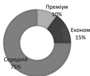
Рисунок 2 – Цінові сегменти ринку будівельних сумішей України [побудовано на основі [4]]

Основний попит формується на сухі суміші середнього цінового сегменту, що відображено на рисунку 2.