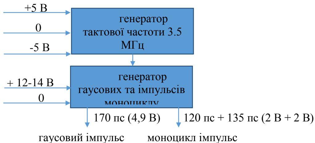
Рис. 1. Блок-схема трансмітера

Схема трансмітера складається з двох частин (Рис 1.): генератора, який задає частоту повторення імпульсів (живиться від двополярного джерела напруги +/- 5 В), та формувача імпульсів (який працює при напрузі + 12-14 В).