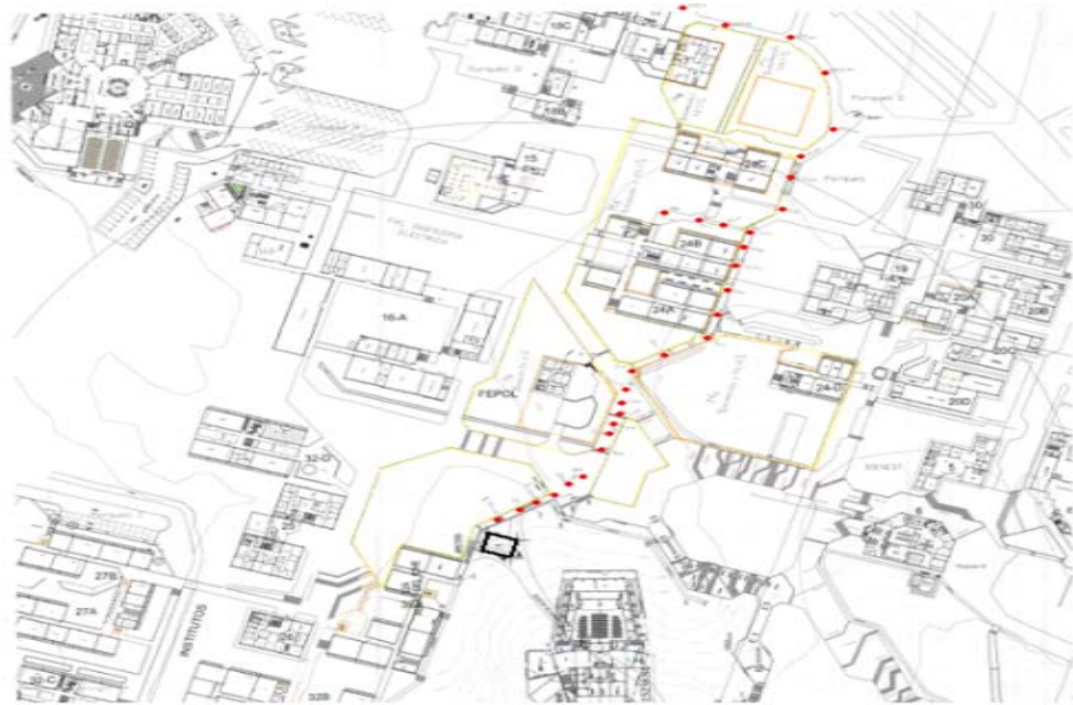
Рисунок 1 – Траса кампусу ESPOL [3]

Чорний квадрат це місце розташування антени, а червоні точки це місця, в яких виміряне потужність. Дані наведено в табл. 1