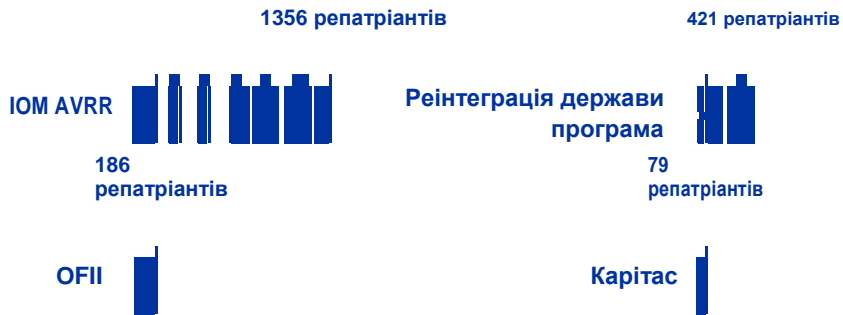
Рисунок 1. Програми допомоги реінтеграції за кількістю мігрантів, яким надано допомогу (травень 2017 – травень 2022)