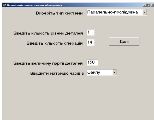
Рис. 2. Вікно введення початкових