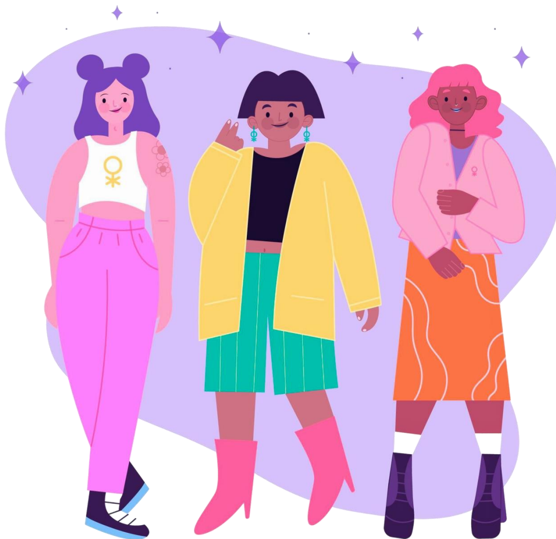
Ілюстрація 1. Обкладинка посібника