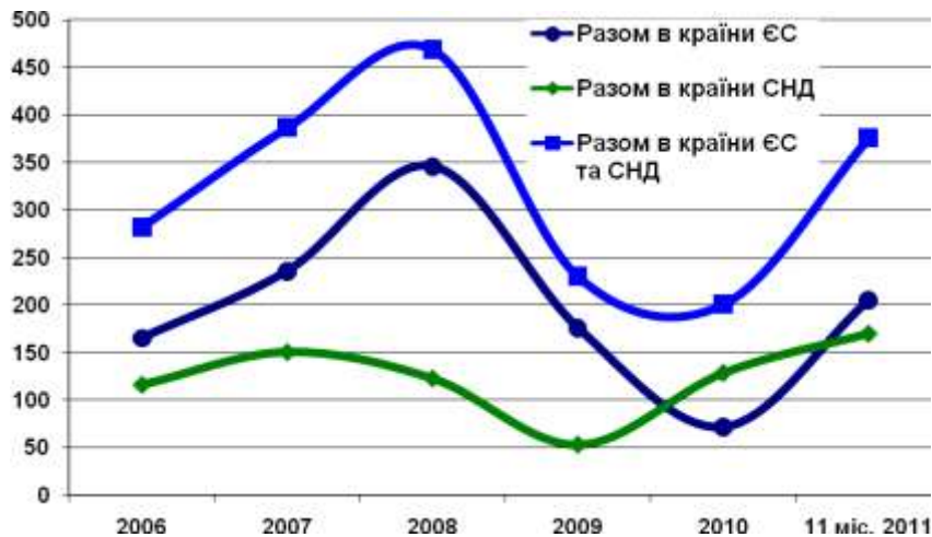
Рис. 2. Динаміка вартісного обсягу експорту електроенергії з України в країни ЄС та СНД, млн дол. США

Динаміка сукупних доходів від експорту електроенергії з ОЕС України та в регіональному розрізі (країни ЄС, СНД) представлена на рис. 2.