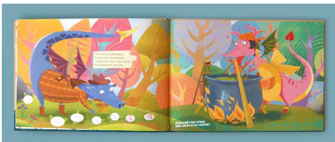
Рис.2.4 - Ілюстрація до книжки К. Міхаліциної «Про драконів і щастя»

Використані кольори є спокійними (зелений та його відтінки), а також такими, що спонукають до розвитку фантазії читача (тіффані, світлий фіолетовий, блакитний, білий). Загальна естетика дизайну в книзі не є агресивною, що сприяє врівноваженому та спокійному проведенні часу з дитиною. Кольори, попри свою насиченість, не є дратівливими, як, наприклад і в роботах Наталки Гайди: