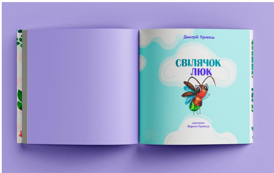
Рис.2.2 - Оформлення титулу