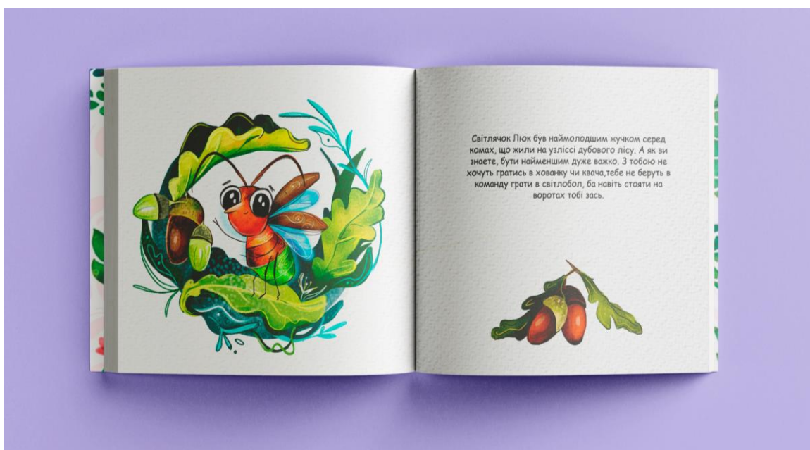
Рис.2.4 - Ілюстрація до «Світлячок Люк. Народження героя або світло в тобі»