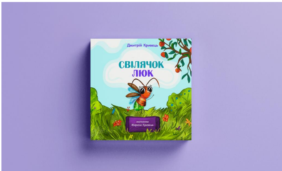
Рис.2.1 - Оформлення обкладинки