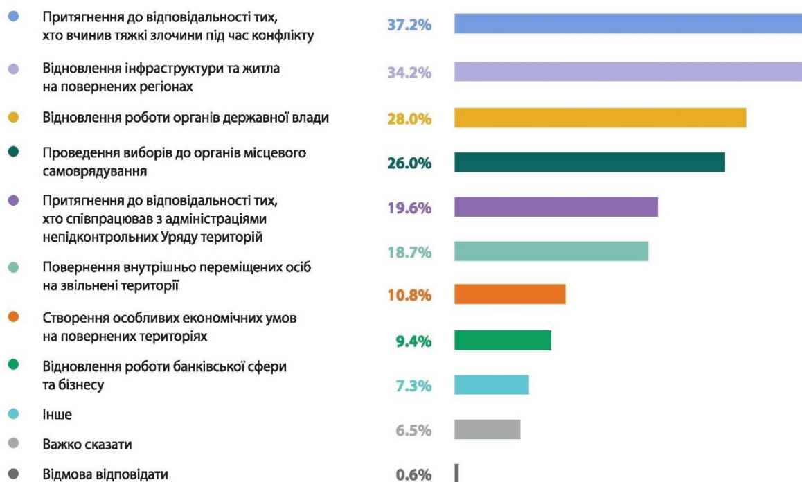
Рис. 3.2 «Якщо звільнення непідконтрольних Уряду територій відбудеться завтра, які першочергові кроки мають бути зроблені державою».

Далі, акторам було запропоновано обрати та представити свої варіанти першочергових дій влади, у випадку повернення територій Донецької та Луганської областей під контроль України. І так найбільш популярною відповіддю, із показником 37.2 відсотка стала відповідь «Притягнення до відповідальності тих, хто вчинив такі злочини під час конфлікту». На другій сходинці, із результатом 34.2 відсотка знаходиться відповідь «Відновлення інфраструктури та житла на повернутих регіонах». Рівно 28 відсотків респондентів обрали пункт «Відновлення роботи державної влади». «Проведення виборів до органів місцевого самоврядування»- саме таким бачать перший крок центральної влади приблизно чверть з опитаних. Далі, 19.6 відсотків набрав варіант відповіді «Притягнення до відповідальності тих, хто співпрацював з адміністраціями непідконтрольних Уряду територію. Лише на бму місці опинився варіант