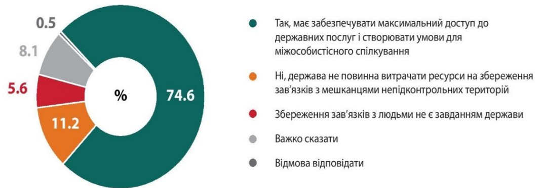
Рис. 3.3 «Чи має держава вживати заходи для підтримки та збереження зв'язків з мешканцями непідконтрольних територій?»

Якщо орієнтуватись у розбудові державної політики на тодішні дописи в соцмережах, то люди робили висновки, що спрощений вступ був негативним кроком. Але коли ми проводили опитування, запитуючи респондентів, чи потрібно зберігати зв'язки з мешканцями окупованих територій, чи потрібно їх підтримувати, то ми отримали обнадійливі результати. Понад 70% громадян підтримують збереження таких зв'язків, а 54,7% розуміють, що жителі ТОТ – жертви конфлікту, а не його творці. Ця ситуація показує бульбашку соціальних мереж. (Zmina, 2018)