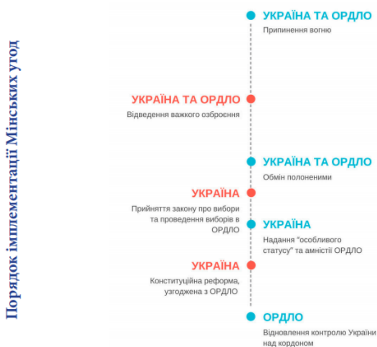
Рис. 3.7 порядок імплементації мінських умов

«нормандської четвірки» можна інтерпретувати кількома шляхами. С одного боку це питання, відсилає до оцінки дій президента України в рамках роботи у групі «нормандської четвірки». А також є варіант оцінки роботи наших партнерів у особах Ангели Меркель, канцлера Німеччини, Мануела Макрона-президента Франції та Володимира Путіна- президента Російської Федерації.