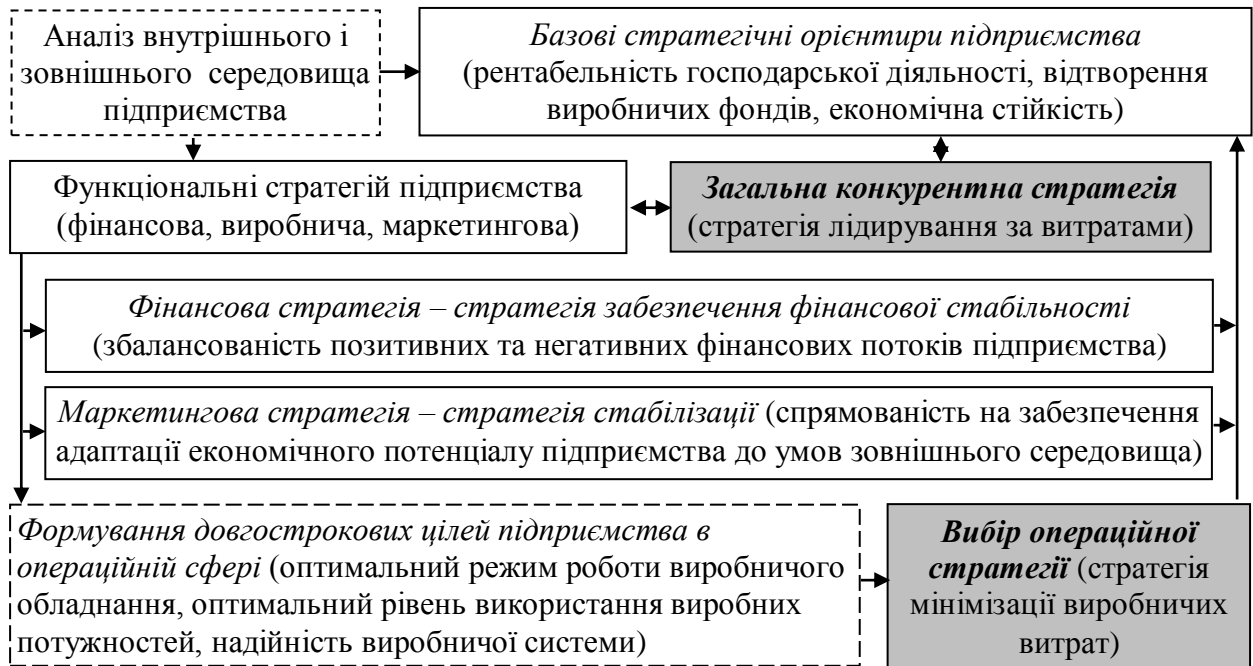
Рис. 3. Операційна стратегія енергогенеруючого підприємства в системі «стратегічного набору» (розроблено автором)

наборі». Представлена модель певною мірою є спрощеною, оскільки не відображає усієї сукупності стратегій, зокрема функціональних, однак дозволяє відобразити основні пріоритети у різних сферах його діяльності за умови несприятливості зовнішнього середовища, тобто прояву системи чинників про які йшлося вище. З огляду на специфіку енергетичної сфери та незважаючи на особливості зовнішнього середовища, зорієнтованість конкурентної стратегії на лідирування за витратами є очевидною.