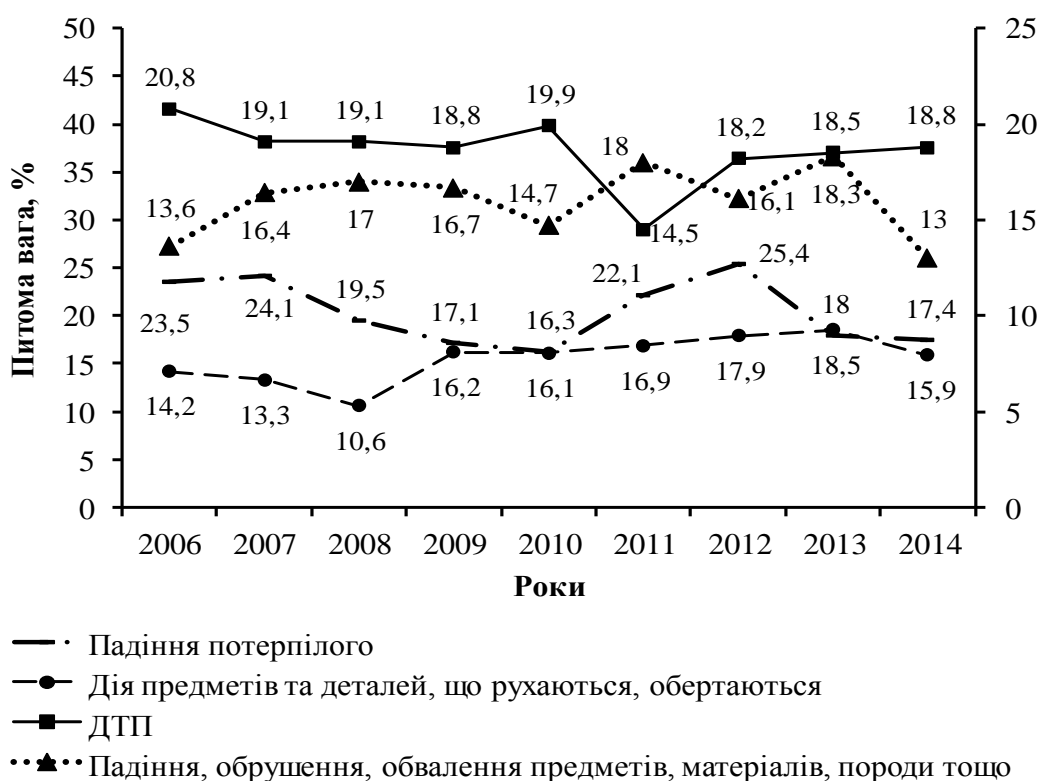
Рисунок 1 – Динаміка змін питомої ваги основних подій, що призвели до нещасних зі смертельними наслідками, в 2006-2014 роках

Основні чотири події, що призвели до настання нещасних випадків на виробництві з тяжким та смертельним наслідками наведено в таблиці 1.3, це – дорожньо-транспортна пригода, падіння потерпілого, падіння, обрушення, обвалення предметів, матеріалів, породи, ґрунту та дія предметів та деталей, що рухаються, розлітаються, обертаються. Їх питома вага в загальному переліку подій, що призвели до виникнення нещасних випадків на виробництві в 2014 році, сумарно становить 65,1% . Динаміка змін питомої ваги основних подій, що призвели до настання нещасних випадків з тяжким і смертельним наслідком в 2006-2014 роки представлено на рисунку 1.