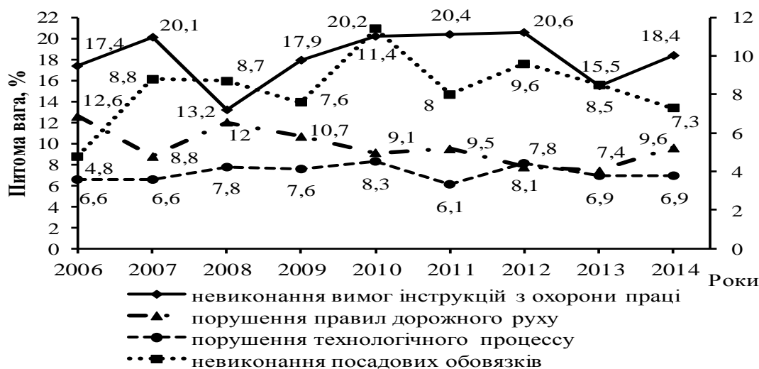
Рис. 4. Динаміка змін питомої ваги основних організаційних причин нещасних випадків на виробництві в 2006...2014 роках

Тенденцію змін питомої ваги основних домінуючих організаційних причин, що призвели до нещасних випадків з тяжкими та смертельними наслідками у звітний період, представлено на рисунку 4.