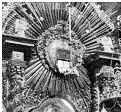
◀ Іл. 2. Царські врата Успенського собору Києво-Печерської лаври та ікона Успіння Богородиці.