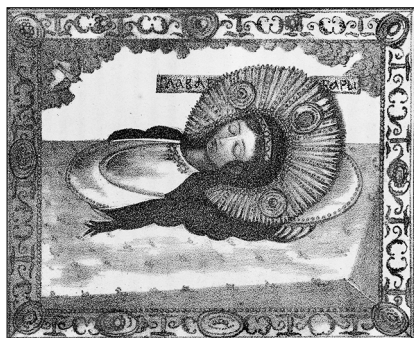
Іл. 4. Зображення ікони з відсіченою главою св. вмц. Варвари у Київському Михайлівському монастирі.

тільки три дорожчі за 60 руб. Надалі всі перстені на пальцях великомучениці зберігаються [20, 186 арк.; 44, арк. 9–10 зв.; 45, 208 арк.; 48, 2 арк.]. Частково коштовні вотиви від визначних осіб приладнували до образу відсіченої глави св. вмц. Варвари, який виносили до мощей лише на час богослужіння [19, с. 220; Іл. 4*]. Отже, в обителі проблему увічнення молитви жертводавців до великомучениці Варвари вирішували компромісно: дари зберігалися в надійному місці, але щоразу були «присутні» на службі, відділені від мощей святої, але приєднані до її ікони.