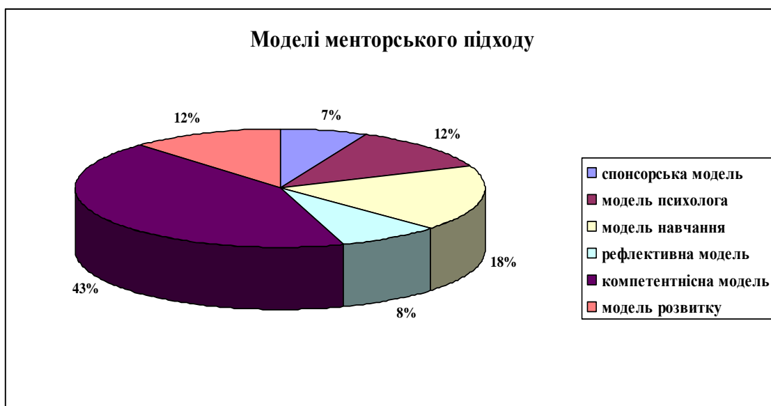
Рис. 2. Відповіді на п'яте запитання.