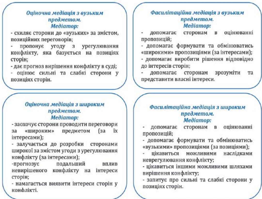
Рис. 2.2 Сітка Л. Ріскіна.

Медіатори використовують сітку Л. Ріскіна як аналітичний інструмент, для оцінки та аналізу ймовірностей і ризиків у складних конфліктах. Вона використовується для моделювання та візуалізації різних сценаріїв розвитку конфлікту з метою прийняття обґрунтованих рішень в умовах невизначеності. За її допомогою можна зробити такі дії: