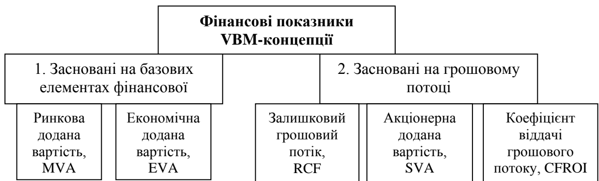
Рис. 1. Класифікація фінансових показників у VBM-концепції

Ключовим рішенням при побудові ефективної системи вимірювання вартості підприємства є рішення про вибір основного показника результативності його діяльності, на базі якого буде побудована і система оцінювання інвестиційної привабливості.