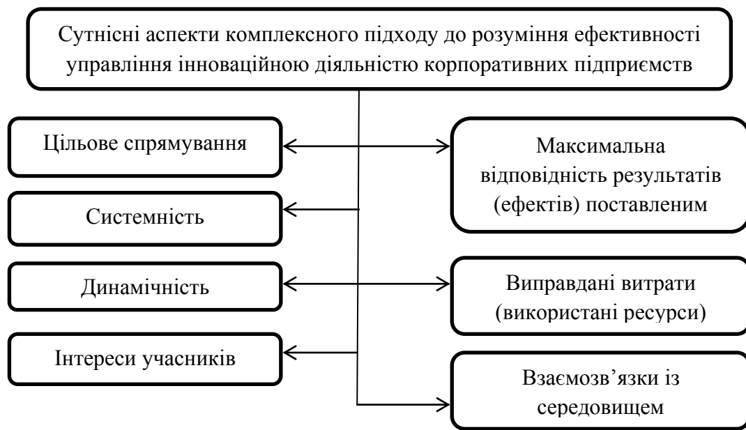
Рис. 1. Комплексний підхід до розуміння сутності ефективності управління інноваційною діяльністю корпоративних підприємств (розроблено автором на основі аналізу)

Під ефективність управління інноваційною діяльністю корпоративних підприємств доцільно розуміти узагальнюючу категорію, яка відображає рівень досягнення поставлених цілей шляхом порівняння результатів (ефектів) із понесеними витратами чи задіяними ресурсами через якісні та кількісні показники з урахуванням інтересів учасників інноваційної діяльності і динамічного впливу на процес управління параметрів внутрішнього та зовнішнього середовища (рис. 2.).