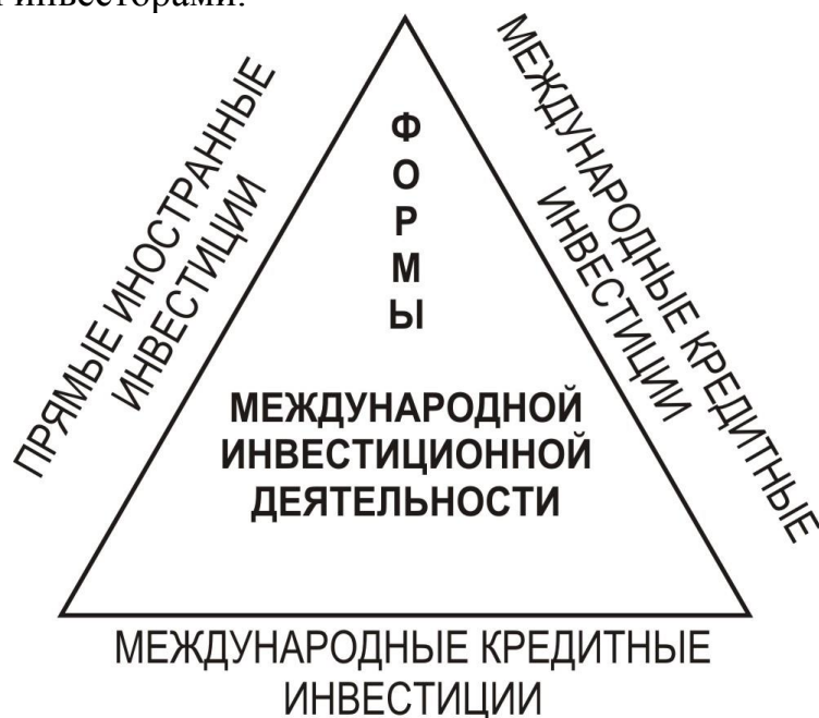
Рис. 2. Видовая характеристика международной инвестиционной деятельности

- со стороны предложения инвестиционных ресурсов для вложений на зарубежных рынках (государства-доноры, частные инвесторы, финансовые посредники). В таком случае речь идет о зарубежных инвестициях, которые осуществляются инвесторами.