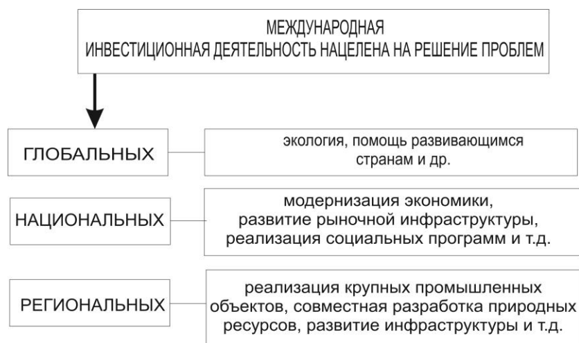
Рис. 1. Целевая компонента международной инвестиционной деятельности

Международная инвестиционная деятельность осуществляется в трех основных формах: прямые иностранные инвестиции, международные портфельные инвестиции и международные кредитные инвестиции.