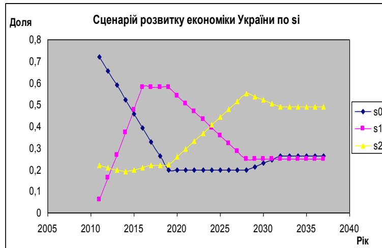
Рис.1. Розподіл інвестицій по секторах для забезпечення оптимального зростання економіки України