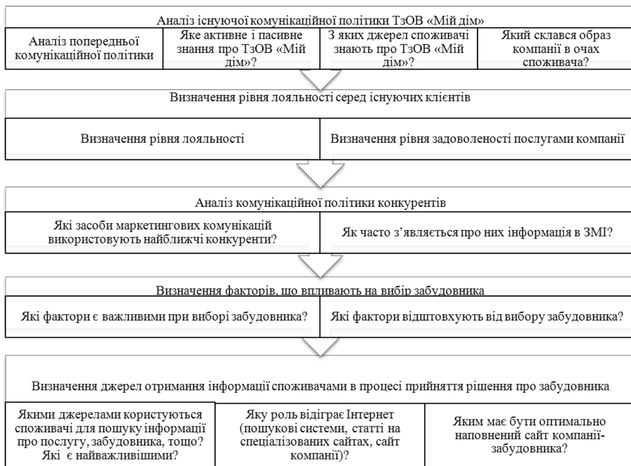
Рис. 3. Етапи отримання інформації у ході проведення маркетингового дослідження

Результати проведеного дослідження показали, що ТзОВ «Мій дім» не має поки що активного знання серед респондентів, а два його конкуренти «Drevodom» та «Екодім» такий показник мають, хоча й дуже низький (2% та 4% відповідно). Тому компанії «Мій дім» варто докладати зусиль з просування для підвищення цього показника.