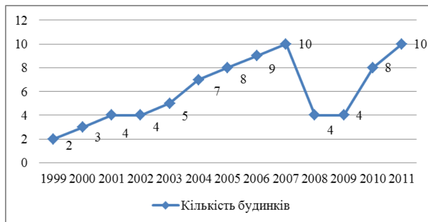
Рис. 1. Кількість побудованих дерев'яних будинків будинків ТЗОВ «Мій дім» за 1999–2011 рр.

На рис.1 наведено динаміку зміни кількості замовлень на будівництво дерев'яних будинків компанією.