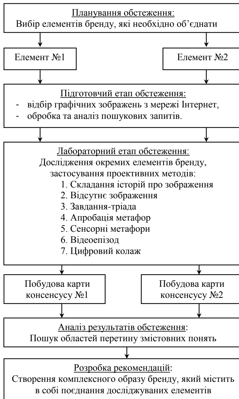
Рис.1. Етапи отримання інформації в процесі дослідження

Застосування проєктивних методів у процесі визначення можливостей диференціації бренду «Millennium» мало певні особливості. Послідовність та зміст запропонованих авторами етапів отримання інформації для створення змістовного зв'язку між окремими елементами бренду зображена на рисунку 1.