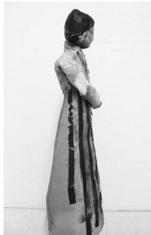
Илл. 4. Скульптурное изображение головы с крестом в лобной части после реставрации. Дерево. Музей им. Занабазара, г. Улан-Батор.

Таким образом, налицо уникальный факт подтверждения летописного свидетельства распространения христианства несторианского