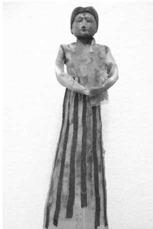
Илл. 3. Скульптурное изображение головы человека с крестом в лобной части после реставрации. Профиль. Дерево. Музей им. Занабазара, г. Улан-Батор.