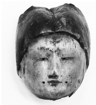
Илл. 1. Скульптурное изображение головы человека с крестом в лобной части. Дерево. Музей им. Занабазара, г. Улан-Батор