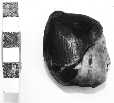
Илл. 2. Скульптурное изображение головы человека с крестом в лобной части. Профиль. Дерево. Музей им. Занабазара, г. Улан-Батор.