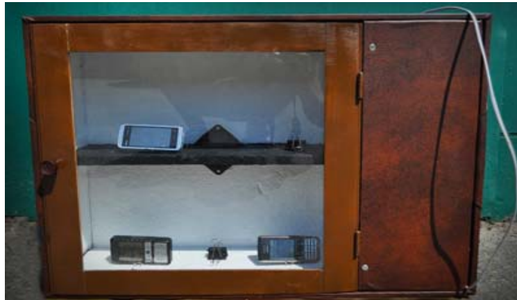
Рисунок 1 – Зовнішній вигляд захисного боксу для мобільних телефонів

Робота присвячена методикам вимірювання пасивних захисних властивостей боксу (звукоізоляції), налаштування рівня та спектру активних звукових перешкод та забезпечення якості звуку сигналу виклику.