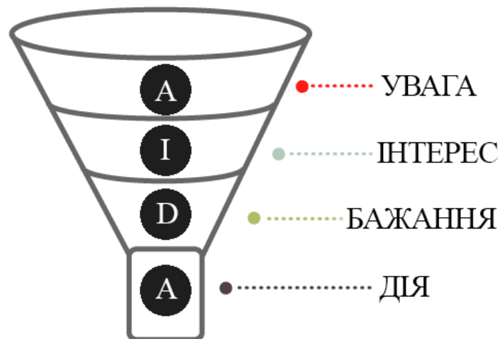
Рисунок 3 - Воронка продажів за моделлю AIDA

Воронка продаж. Також, доволі поширеним методом управління клієнтами, який безпосередньо пов'язаний з процесом їх прийняття рішень є воронка продаж. Воронка продаж представляє собою шлях, за яким проходять покупці від елементарного ознайомлення з продуктом до його покупки. Тобто це схема розподілу споживачів по фазам процесу продаж. Найчастіше, для опису воронки продаж використовують так звану модель споживчої поведінки AIDA. Наочно зобразити дану модель можна приблизно наступним чином [10]: