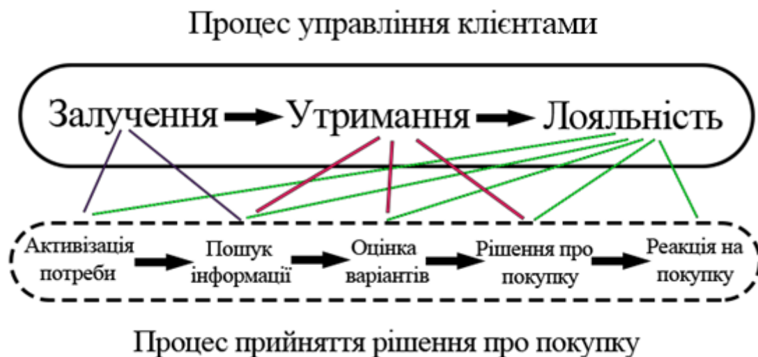
Рисунок 1 - Кореляція між процесами управління клієнтом та прийняття рішення про покупку [2,6]

Результати дослідження. Почнемо з того, що для повного розуміння матеріалу, потрібно чітко розмежовувати поняття покупець, клієнт та споживач, зрозуміти основні психологічні зв'язки тощо. Відповідно, процес управління клієнтами можна розглядати в кореляції з процесом прийняття рішень про покупку, який схематично можна зобразити за допомогою наступного малюнку: