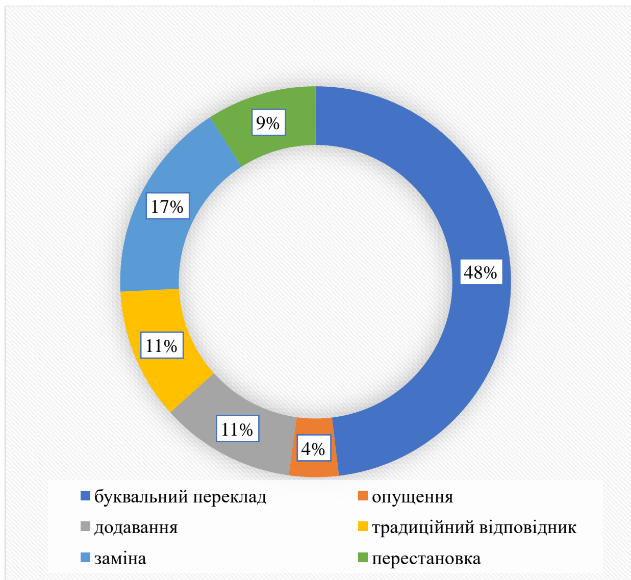
Рисунок 3.2 – Стратегії перекладу промов Б. Джонсона відповідно до класифікації Дж. Мелоуна