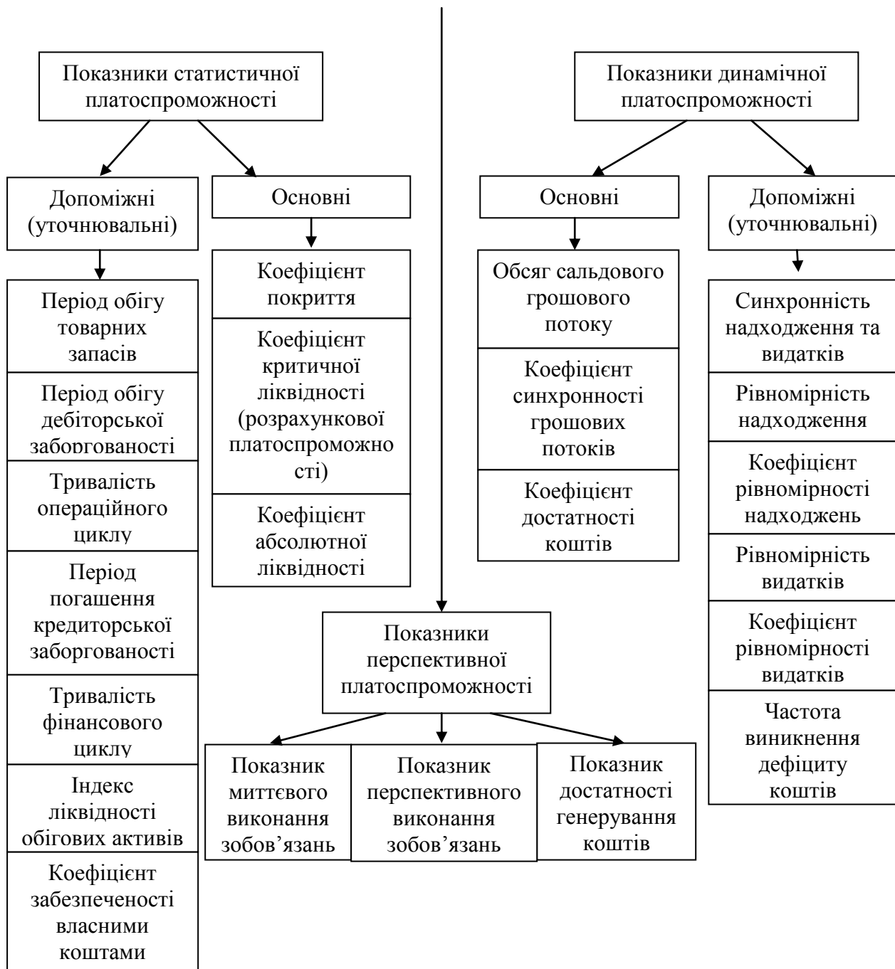
Рис.1. Система показників платоспроможності підприємств

Для обчислення цих показників використовують спільний знаменник - короткострокові зобов'язання. Поточну платоспроможність слід оцінювати як сукупну величину короткострокових кредитів, позик, не погашених в строк, короткотермінових фінансових вкладень до короткотермінових зобов'язань. Теоретичне значення цього коефіцієнта становить приблизно 0,2-0,25. Особливий інтерес цей показник має для банків, які саме і кредитують підприємства та постачальників матеріальних ресурсів. Головною метою