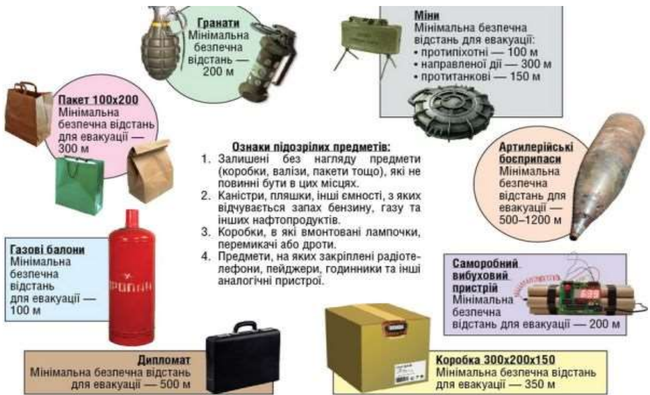
Рис. 2. Види вибухонебезпечних предметів

До основних видів вибухонебезпечних предметів відносяться: авіаційні бомби (авіаційні касети, бомбові зв'язки, запальні баки та ін.); ракети (ракетні боєголовки); снаряди систем залпового вогню; постріли і снаряди польової, самохідної, танкової та зенітної артилерії; мінометні постріли й міни; боєприпаси протитанкових ракетних комплексів і протитанкових гранатометів; патрони авіаційних кулеметів, гармат і стрілецької зброї; гранати; морські боєприпаси (снаряди бойової та корабельної артилерії, торпеди, морські міни, тощо); інженерні боєприпаси; вибухові речовини; табельні саморобні та інші пристрої, які містять вибухові матеріали; хімічні та спеціальні боєприпаси. (рис.2)