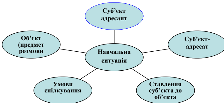
Рис. 1. Компоненти професійної навчальної ситуації (за О. Бернацькою)