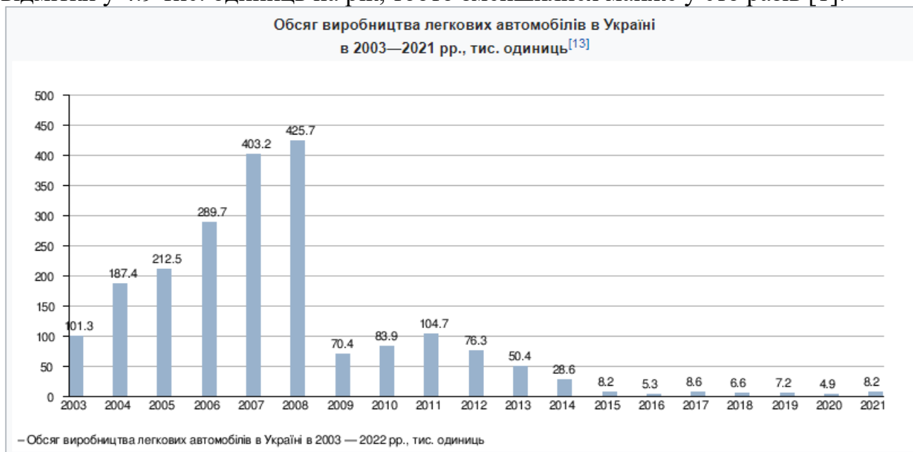
Рисунок 1 – Динаміка обсягу виробництва легкових автомобілів в Україні у період 2003-2022 рр., тис. одиниць

Українське виробництво автомобілів процвітало і розвивалось ще у 2008р, а вже в 2009 р. різко пішло на спад (рис. 1). Лише за один рік це виробництво скоротилося з 425.7 тис. одиниць до 70.4 тис. одиниць на рік. Як бачимо, після кризи глобальної економіки 2008 р. ще спостерігалися успішні спроби відновити виробництво, але вже у 2011 р. показники знову пішли на спад і у 2020 р. досягли відмітки у 4.9 тис. одиниць на рік, тобто зменшилися майже у сто разів [1].