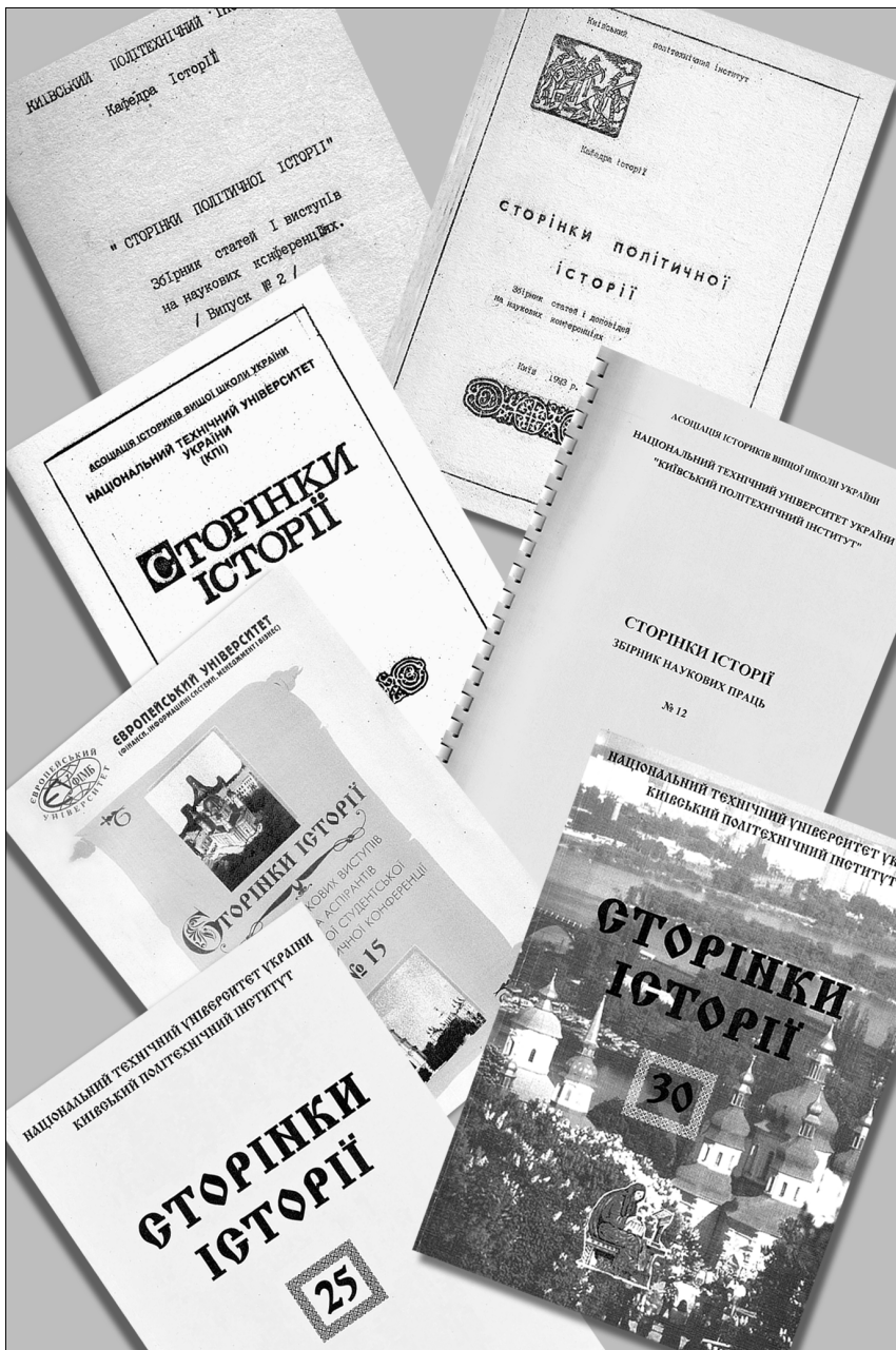
«Сторінки історії». Випуски різних років